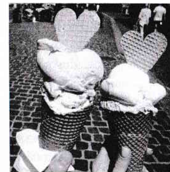
Oprire dulce Brașov

În ultimul an mă pregătisem intens pentru masterul în graphic design ce avea să mă aștepte pe meleaguri străine. Nu prea știam să desenez, așa că în octombrie 2017 am început să învăț.